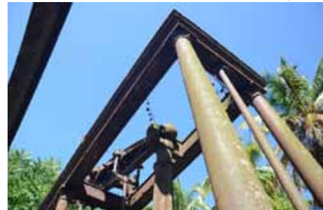
• Les colonnettes du châssis et le cadre supérieur

fibreux des tiges de canne broyées, desquels est extrait le vesou, quant à lui, était récupérée et servait de combustible au foyer de la machine à vapeur. Ceci permettait de contribuer à l'autonomie énergétique du moteur. Tout simplement ingénieux !