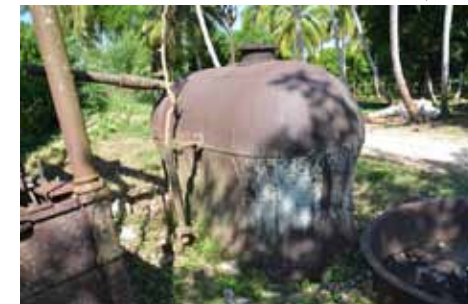
• La chaudière aux formes convexes en son équateur

panneau de signalisation et une table de lecture pour les visiteurs. L'érection d'une clôture de protection de type "cyclone" a été envisagée afin de protéger cette merveille technologique, objet fétiche du XIXème siècle naissant et témoin unique de l'immense progrès franchi par l'Humanité et qui a permit la Révolution industrielle en Europe.