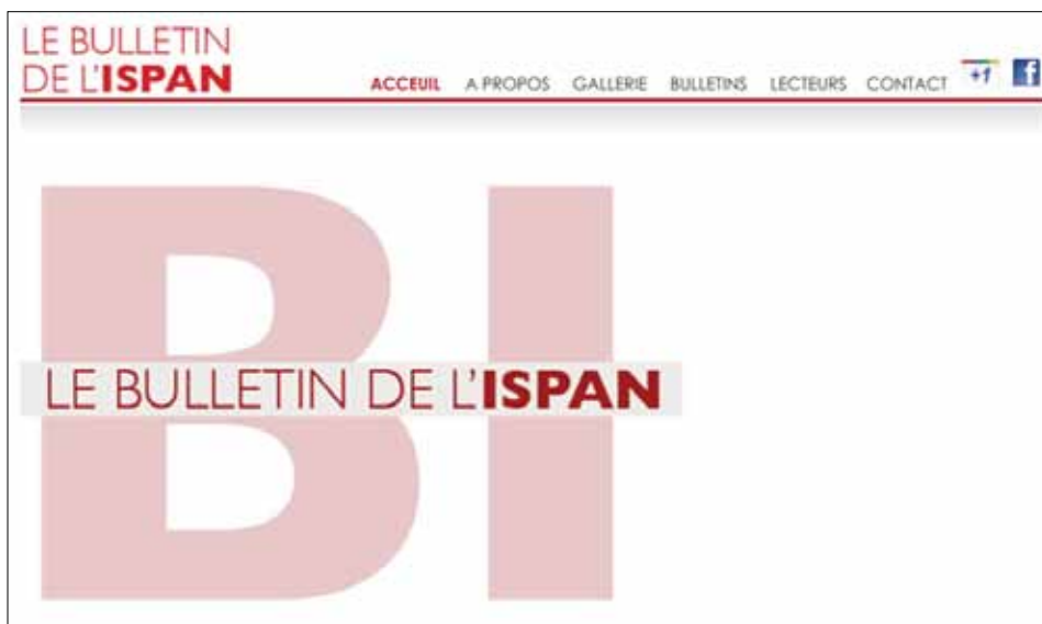
• Page d'accueil du site Internet du BI