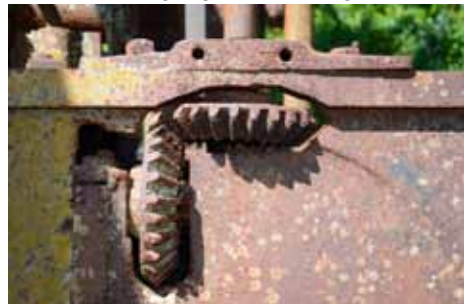
• Les engrenages en biseau du régulateur à boules

Comme pour les entrées d'alimentation en vapeur du cylindre à piston, cet axe peut être positionné de manière à faire fonctionner des équipements (moulins, presses ou autres) des deux côtés de la machine. Cet axe transmet à un grand engrenage dentelé le mouvement rotatif aux cylindres broyeurs du moulin à canne. L'imposant diamètre de cet engrenage permet d'abaisser la vitesse du volant.