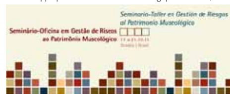
• Logo du séminaire