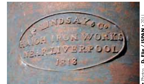
• Inscription sur le cylindre à piston

Js LINDSAY & Co. HAIGH IRON WORKS NEAR LIVERPOOL 1818