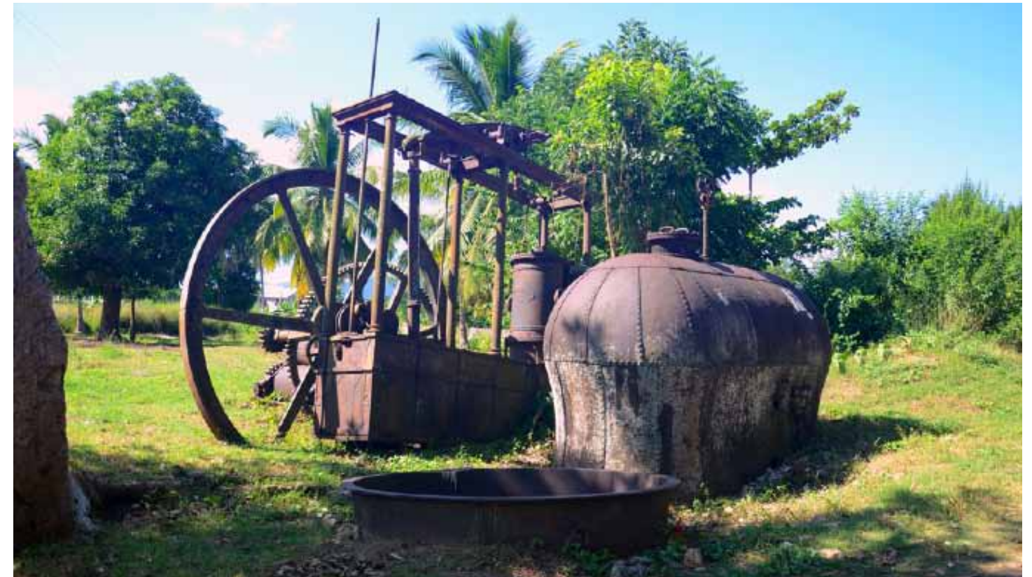
• Le moulin Price : à g., le volant d'inertie, au c., le chassis, le cylindre et la citerne de condensation et à d., la chaudière. En avant-plan, une cuve.

Schématiquement, il est composé d'un réservoir - la chaudière - remplie d'eau placée au-dessus d'un foyer alimenté par du feu de bois ou de bagasse. Portée à ébullition, l'eau se transforme en vapeur qui exerce une puissante pression contre les parois de la chaudière. Cette énergie produite est récupérée au moyen d'un tube connecté à la chaudière pour actionner un cylindre à piston qui engendre, par le biais d'un mécanisme de récupération et de régulation, un mouvement vertical ascendant-descendant. Celui-ci est, à son tour, transformé en mouvement circulaire permettant ainsi d'actionner les cylindres broyeurs du moulin de canne à sucre. L'ensemble de la machine est posé sur une citerne de condensation, solide caisse en plaques métalliques, destinée à transformer la vapeur sortant de la machine en eau. Cette