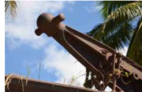
• Une des extrémités du balancier

écrous et, après quoi, les auraient courbé avec force vers l'extérieur de sorte que le bonnet ne pût être remplacé. Le mystère, dit-il, s'approfondit quand on regarde le grand engrenage attaché à la role menante : deux de ses rayons ont été taillées presque à moitié. Ce qui le fragiliserait dangereusement en cas de mise en marche. Le moulin Price aurait-il été victime d'un acte de sabotage ? Roosevelt est positif là-dessus : la machine a été sabotée avant qu'elle aie pu écraser aucune tige de canne. L'examen de l'aileron placé au bout de l'axe du volant et l'engrenage de la role menante ne révèlent absolument aucune évidence d'usure !