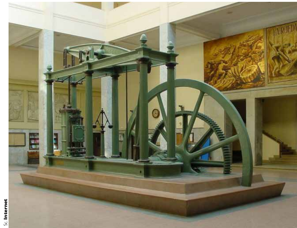
• Machine similaire à celle du moulin Price, fabriquée par Jukes Coulson & Compagnie

d'une cheminée. Tout près, sur le sol, se trouvait une de ces chaudières hémisphériques en fer d'environ 6 pieds de diamètre, communes à plusieurs anciens moulins à sucre des caraïbes. Ces ruines paraissaient être les restes d'une construction où le sirop de canne était cuit pour former des cristaux de sucre." Il était en présence du moulin Price de Jacmel. Son article demeure un témoignage précis sur l'histoire, l'état de conservation et des interprétations que pouvait se faire un chercheur en cette seconde moitié du XXème siècle et un document de première main pour la mise en valeur de ce bien culturel unique que possède Haïti. Tant par la précision de ses observations que par les informations collatérales permettant