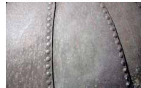
• Plaques métalliques rivetées de la chaudière

eau est récupérée et servira à alimenter, à nouveau, la chaudière.