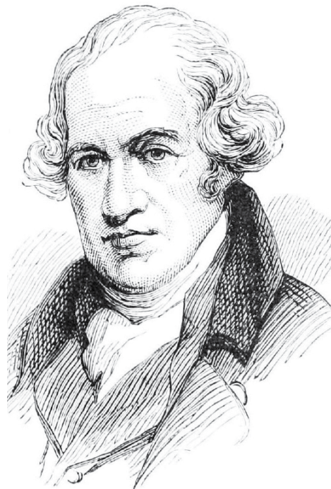
• James Watt (1736-1819), inventeur de la machine à vapeur

L'étrange machine n'échappa cependant point à la curiosité des Marines patrouillant dans la zone durant l'Occupation américaine d'Haïti (1915-1934). Elle fut, rapporte-t-il, repérée dès 1929. "Pendant l'été de cette année, le jeune fils d'un officier américain, au cours d'une randonnée à cheval sur la côte sud de l'île, tomba sur une ancienne machine à vapeur et un moulin à sucre. La machine fut photographiée