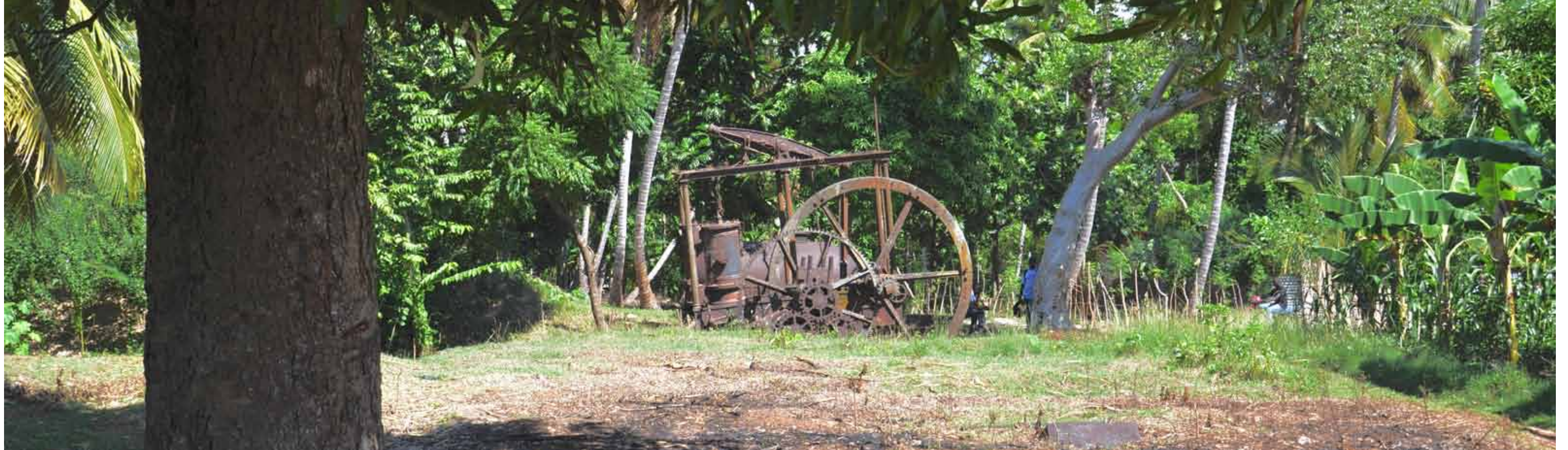
• Le moulin Prince dans son environnement actuel

mouvement rotatif recherché. C'est, vraisemblablement, l'une des toutes premières illustrations de l'utilisation du système bielle-manivelle dans la machine à vapeur.