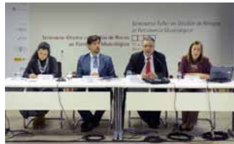
• Le comité organisateur du séminaire en Gestion de Risques appliqués au Patrimoine Muséologique à Brasilia, Brésil.

ro-américain (SEGIB) et l'UNESCO. Le représentant du Conseil International des Musées (ICOM) à ce séminaire s'est proposé pour la rédaction d'un protocole d'accord entre l'ISPAN et le Programme Ibermusées.