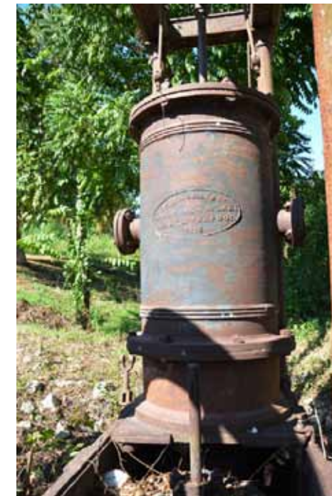
• Le cylindre à piston et ses deux entrées latérales