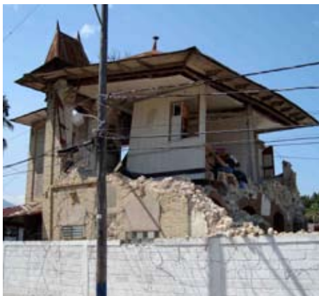
Résidence gingerbread au Bois-Verna, endommagée par le séisme du 12 janvier

Au cours de sa présentation, Mme Rocourt a insisté sur le fait que ce parc national historique, seul site haïtien classé au Patrimoine Mondial de l'Humanité, représentait un potentiel économique extraordinaire qui n'exigerait que relativement peu de ressources en investissements.