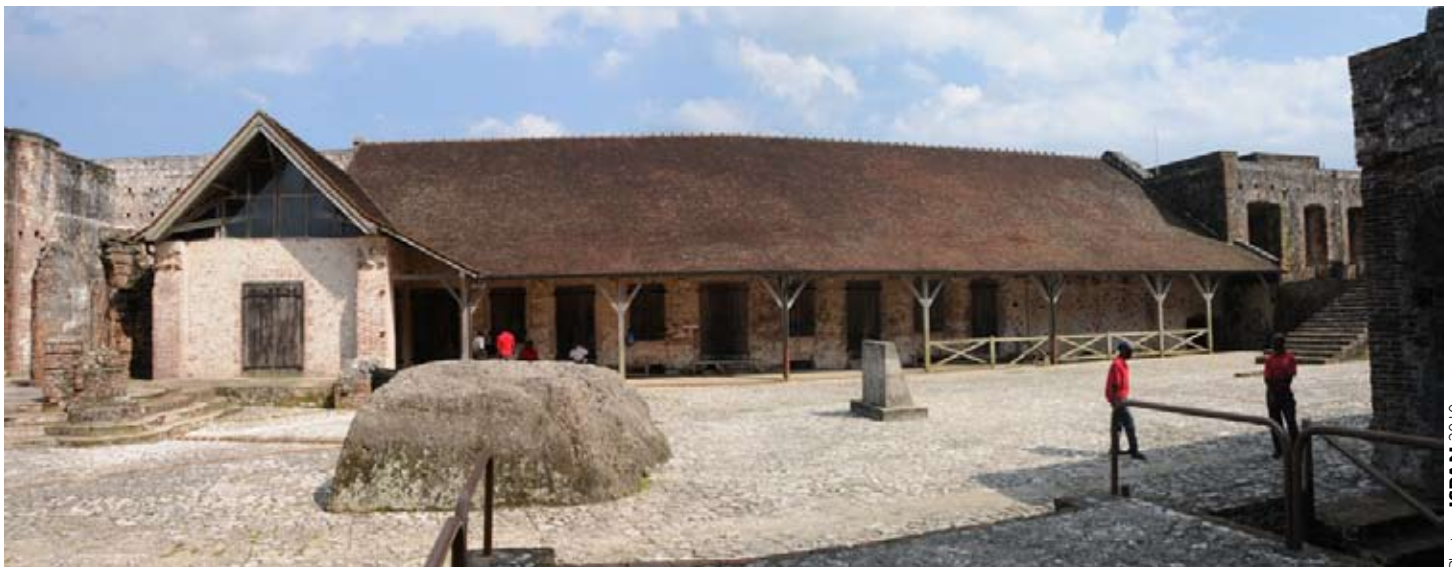
• Le Quartier des Officiers (au fond) et la cour centrale de la Citadelle Henry