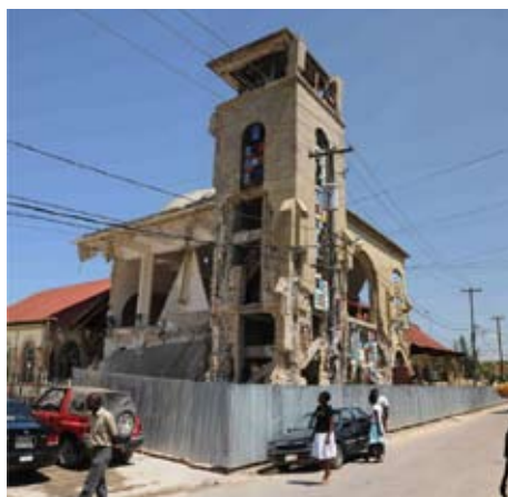
L'église du Sacré-Coeur de Turgeau clôturée