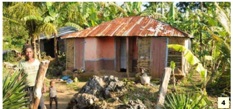
1. Aire de stationnement de Choiseul 2. Le clocher de Milot 3. L'église de Milot 4. Logement type des habitants du parc