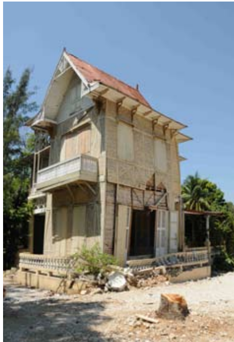
Résidence gingerbread au Bois-Verna (Maison Bazin)

Précédemment, cette même opération d'identification avait été réalisée du 22 au 24 février dernier